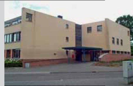
Aan de rechtergevel wordt een scootmobielruimte aangebouwd.

Voor de bouwvakvakantie (20 juli) zal het gebouw wind- en waterdicht gemaakt zijn. Na de bouwvak (17 augustus) wordt de ruimte nog afgewerkt met schilderwerk en vloerafwerking. Pas dan kunnen we de ruimte in gebruik nemen.